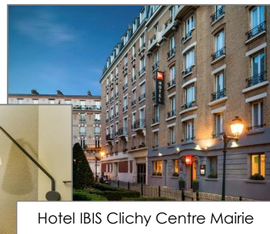
Hotel IBIS Clichy Centre Mairie

Pris: 4.900 kr per person i dubbelrum från Kastrup/Arlanda/Landvetter.