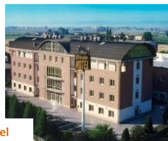
Best Western Hotel