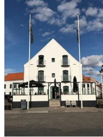
Marcussens Hotel, Assens