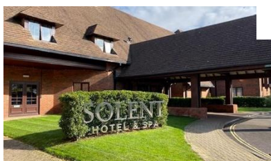
Solent Hotel SPA